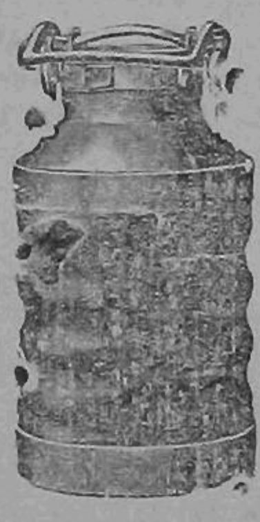
LA CASA QUE ES GARANTIA PARA EL COMPRADOR

INODOROS AMERICANOS Tanque alto y tanque bajo COCINAS PARA LEÑA Tres tamaños, a precios de ocasión